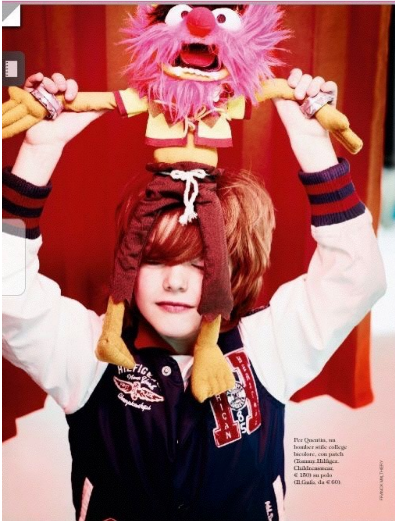
Per Quentin, un bomber stile college bicolor, con patch (Tommy Hilfiger Childrenswear, € 180) su polo (Il Gallo, da € 60).